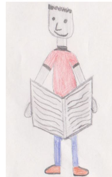
Dessin de Rafael Dewez

Le journal scolaire est un projet coopératif qui place l'enfant dans une situation de communication authentique : le journal est destiné à être lu par un public qui dépasse le cadre de la classe, voire celui de l'école, c'est donc un outil de valorisation, d'ouverture et de médiation. La finalité est que ce journal devienne un outil que l'élève s'approprie.