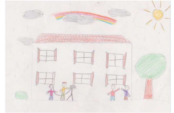
dessin de Rachel FARIB

Dès l'école primaire, l'éducation à l'image, au cinéma et à l'audiovisuel permet aux élèves d'acquérir une culture, d'avoir une pratique artistique et de découvrir de nouveaux métiers.